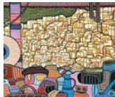
Artiste: André GILLES - Support: 100% - Titre: La Rencontre au Palais Format: 60 x 80 cm Prix: 10.000 € - Page: 10